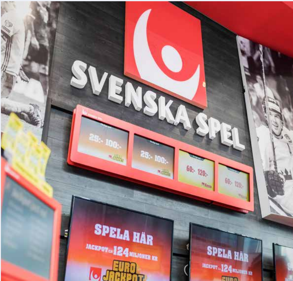
Svenska Penninglotteriet och Tipstjänst AB går ihop 1997 och byter namn till Svenska Spel AB.

verkar inom branscherna för livsmedel, tobak med mera. Regeringen säljer 75 procent av statens aktier i försvarskoncernen Celsius men behåller röstmajoriteten och aktien noteras på Stockholms Fondbörs A-lista. Assi AB och Domän AB slås samman till AssiDomän AB, som lägger bud på NCB. Securum skjuter till 10 miljarder kronor för att rädda Nordbanken. Televerket ombildas till Telia AB. AMU-gruppen bolagiseras.