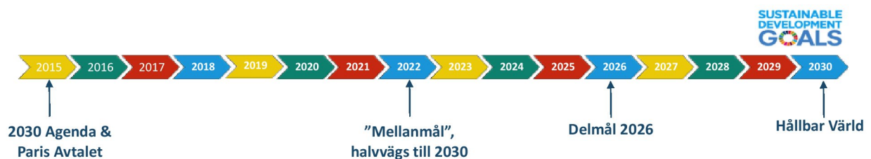
Figur 1: Tidsaxel med "mellanmål" och större avstämningar vart fjärde år

Att tillsätta en kommitté är ett utmärkt förslag och vi håller med om det som sägs i kapitlet. För att kommitténs arbete ska bli så effektivt som möjligt krävs dock konkreta milstolpar eller tidsmässiga delmål på vägen till 2030. Vi föreslår dels ett "mellanmål" år 2022, halvvägs till 2030 sedan 2015 och ytterligare en milstolpe år 2026, för att slutligen se till att målen nås fullt ut senast 2030. Vi skulle gärna se att en representant från 2022 Initiative Foundation ingår i kommittén.