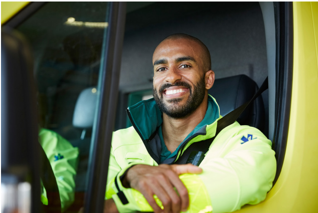
Ett tryggt arbetsliv