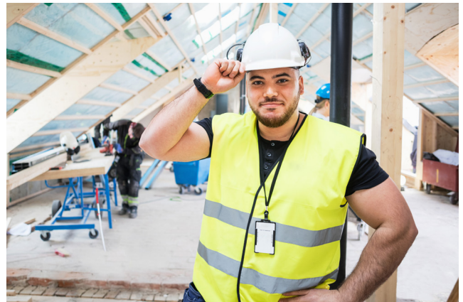
En arbetsmarknad utan fusk och brott