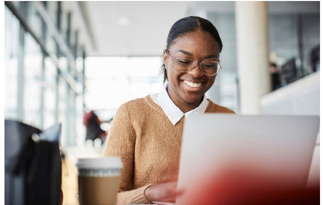
Ett hälsosamt arbetsliv