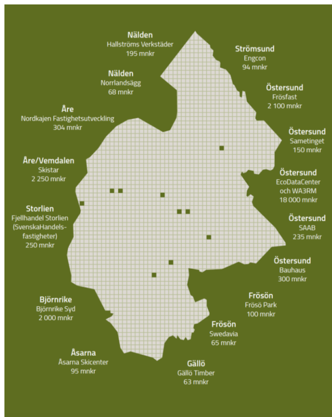
Bild: Urval av planerade investeringar i Jämtland/Härjedalen

Alla de ovan beskrivna investeringarna kommer att ställa högre krav på infrastrukturen i och med större efterfrågan på som resultat av ökande produktion av skog, trä, malm, stål och andra produkter. Vi behöver se mer av mod, visionärt tänk, transparens, tydlighet och långsiktighet från både Trafikverket och Sveriges regering. Den kommande nationella planen är kanske en av de viktigaste på många årtionden. En plan kan inte lösa allt men den kan vara en signal och fingervisning vart vi vill. Framtiden för Sverige AB som ledande industrination står på spel om vi inte skapar de bästa långsiktiga förutsättningarna för företagen som är beredda att investera. Sverige är ett rikt land där vi inte ska behöva välja om vi ska kunna flyga eller åka tåg, om vi vill kunna frakta på tåg, lastbil eller båt.