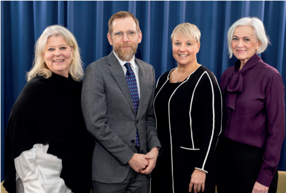
Socialdepartementets fyra statsråd: socialtjänstminister Camilla Waltersson Grönvall, socialminister Jakob Forssmed, äldre- och socialförsäkringsminister Anna Tenje och sjukvårdsminister Acko Ankarberg Johansson.

De nordiska regeringarnas samarbete på social- och hälsoområdet leds av Ministerrådet för social- och hälsopolitik (MR-S). Under året som ordförande är det några områden som är särskilt prioriterade, som också kopplar an till Sveriges övergripande program. Ta del av några inledningsord av socialminister Jakob Forssmed nedan.